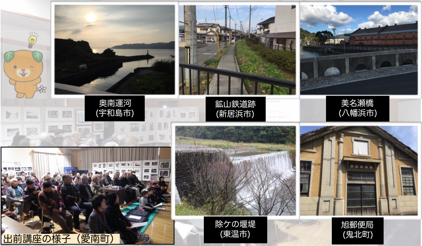
奥南運河 (宇和島市)