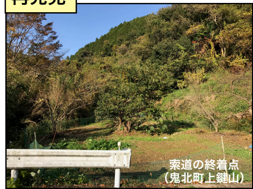
索道の終着点 （鬼北町上鍵山）