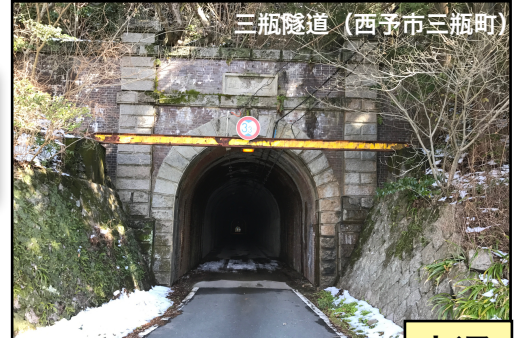
三瓶隧道（西予市三瓶町）