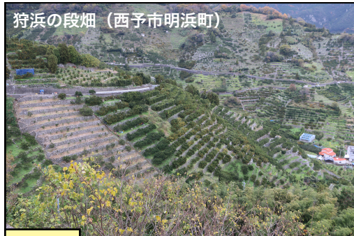
狩浜の段畑（西予市明浜町）