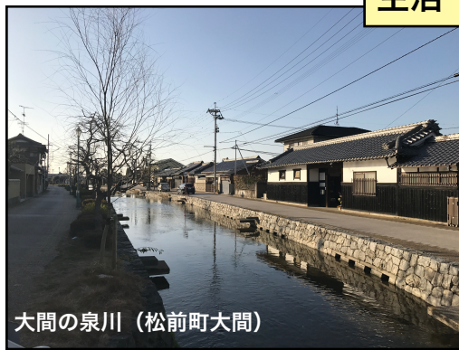
大間の泉川（松前町大間）