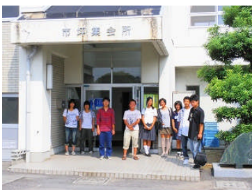
9 名ががんばっています