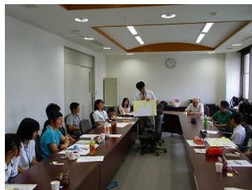
意見を発表しあう