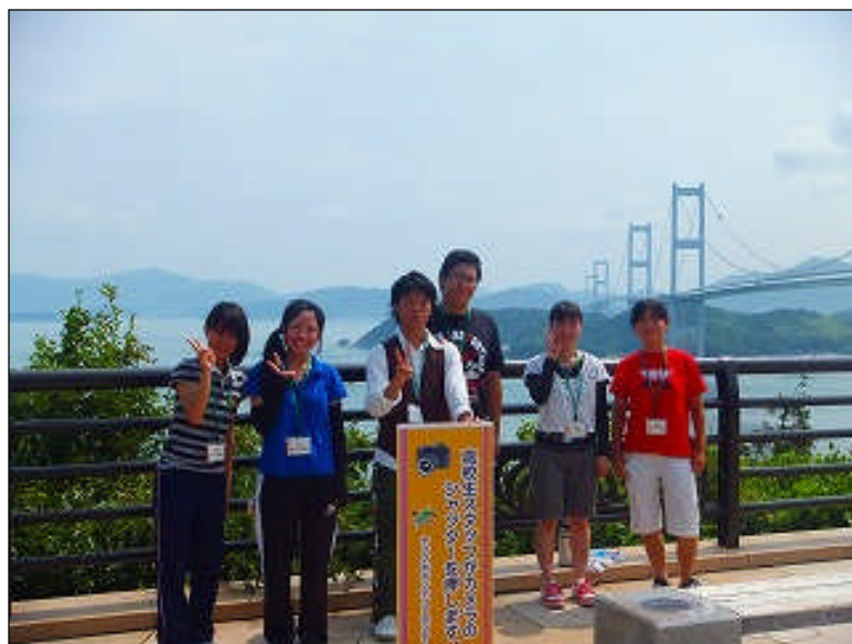
平成 23 年 7 月 31 日 シャッターボランティア in 今治