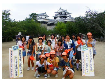
松山は 28 人が参加