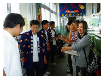
部員へインタビュー