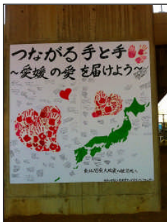
東北へのメッセージ