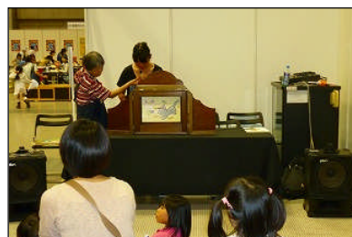
子ども博での活動