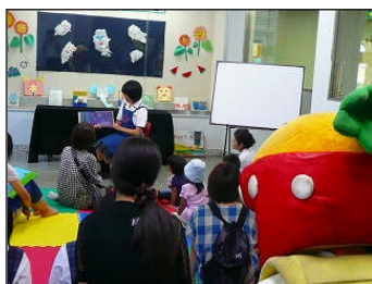
県立図書館での活動