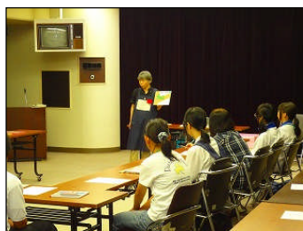
読み聞かせ講習会