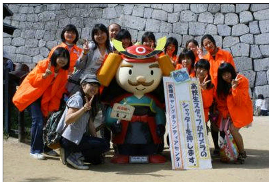
平成 23 年 5 月 4 日 シャッターボランティア in 松山城