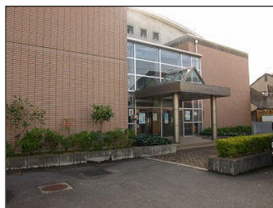
会場の堀江公民館